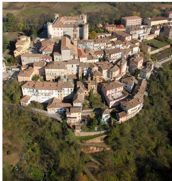
La Rocca di Costigliole d'Asti

L'associazione "Costigliole Cultura" A.P.S. promuove la ricerca e il mantenimento della memoria collettiva, la conservazione e la tutela del patrimonio artistico, storico e culturale del territorio costigliolese e astigiano in tutte le sue forme ed espressioni.